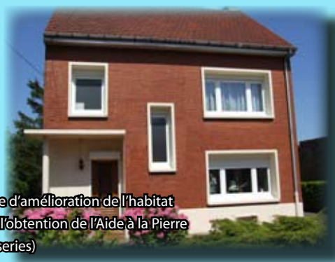
Exemple d'amélioration de l'habitat grâce à l'obtention de l'Aide à la Pierre (Menuiserie)

Enfin, la Communauté d'agglomération de Lens-Liévin notifie au demandeur la décision et le montant de la subvention attribuée.