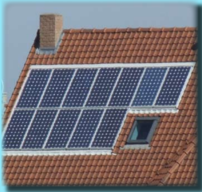
Maison équipée de panneaux solaires

Conception : service Communication - Communauté de Lens-Liévin - 21 rue Marcel Sembat - BP 65 - 62302 LENS Cedex