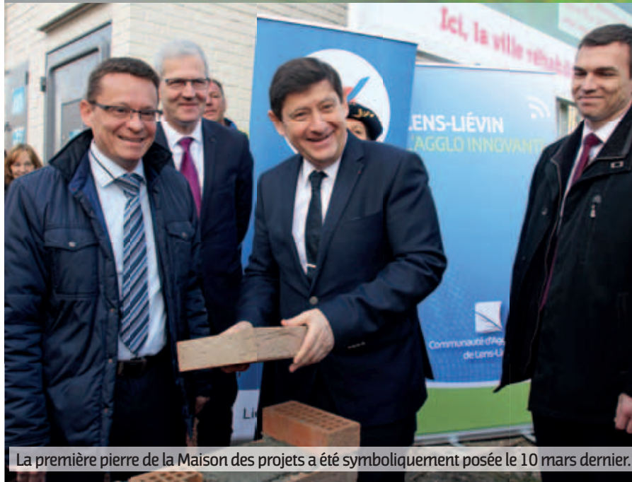
La première pierre de la Maison des projets a été symboliquement posée le 10 mars dernier.