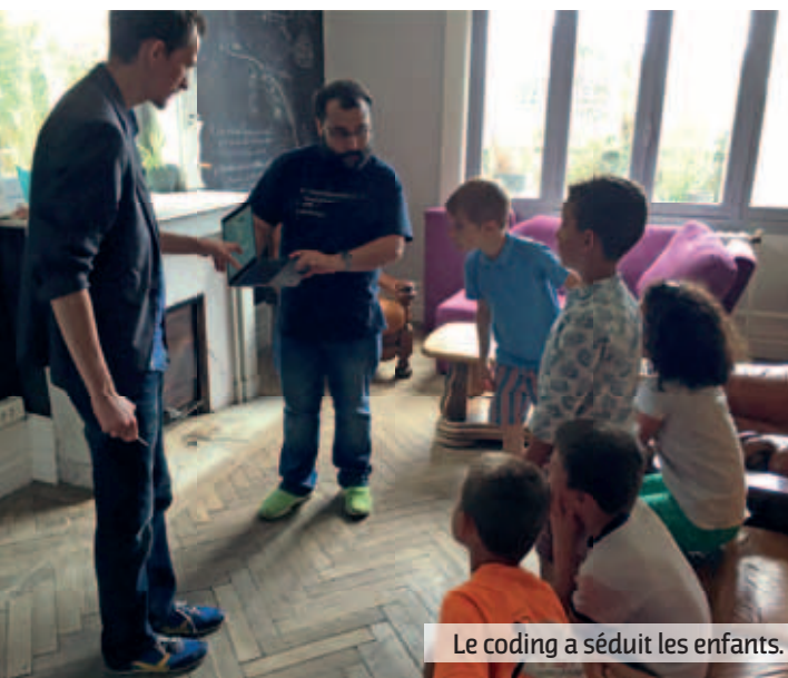
Le coding a séduit les enfants.