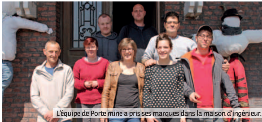
L'équipe de Porte mine a pris ses marques dans la maison d'ingénieur.