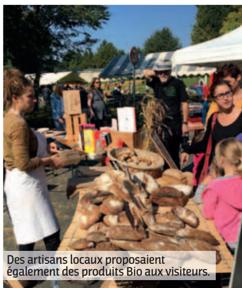
Des artisans locaux proposaient également des produits Bio aux visiteurs.