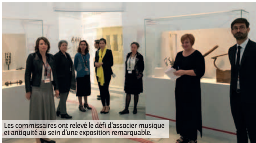
Les commissaires ont relevé le défi d'associer musique et antiquité au sein d'une exposition remarquable.

S'il est impossible de restituer précisément des airs de cette époque, les commissaires se sont essayés à reproduire des bruits qui devaient émaner d'instruments de ces temps anciens. D'autres éléments comme les urnes, mosaïques et objets du quotidien font référence à la musique, omniprésente dans l'existence des peuples de l'antiquité. Élément au service du pouvoir, support des rites religieux, compagnon indéfectible des armées..., la musique était une composante qui rythmait la vie durant cette période de l'histoire. Autre constat que dressent ces travaux de recherches, les instruments se sont exportés, la musique a voyagé et elle s'est petit à petit codifiée.