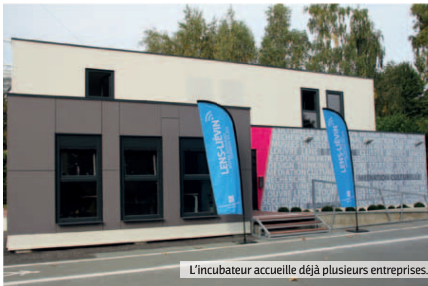
L'incubateur accueille déjà plusieurs entreprises.

La CALL planche également sur la réhabilitation de l'ancienne école Paul Bert qui va se transformer en bâtiment totem et accueillir l'incubateur. Les