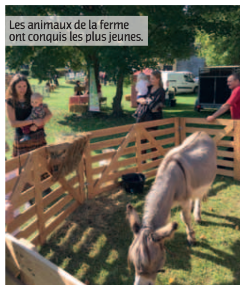
Les animaux de la ferme ont conquis les plus jeunes.