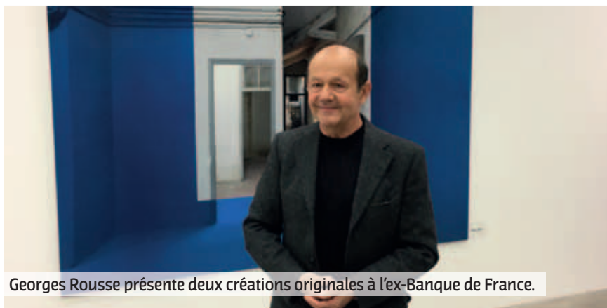
Georges Rousse présente deux créations originales à l'ex-Banque de France.

Le vernissage de l'exposition Détournement de fonds de Georges Rousse s'est déroulé jeudi 14 septembre dans les locaux de l'ancienne Banque de France, située rue de la Paix à Lens.