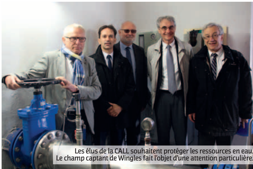
Les élus de la CALL souhaitent protéger les ressources en eau. Le champ captant de Wingles fait l'objet d'une attention particulière.

Chaque année, les élus décident des travaux à réaliser afin de poursuivre ce schéma directeur et les services s'attachent à mettre en œuvre chaque année la politique d'investissement communautaire en eau et assainissement sur le territoire de la CALL et ils assurent le suivi des travaux neufs et de maintenance. Le budget annuel moyen alloué depuis 2011 est de 6 millions d'euros. Une attention particulière est portée sur le champ captant de Wingles qui alimente près d'un quart de la population de notre territoire et qui de fait représente un véritable trésor sous nos pieds. La ressource riche et abondante, indispensable à la vie, doit être préservée. La CALL a donc entrepris des travaux, commencement d'un vaste programme d'action. Ainsi, une opération de reconquête de la qualité de l'eau a été