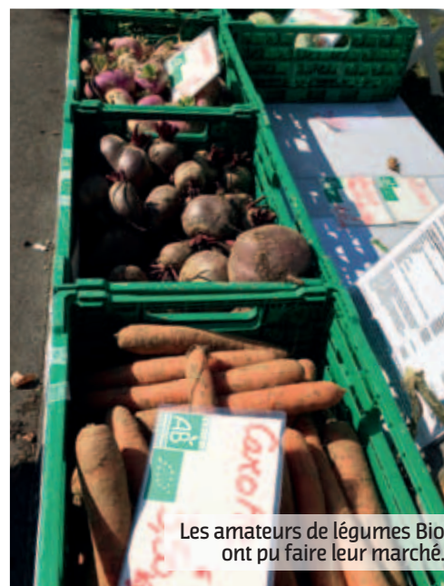
Les amateurs de légumes Bio ont pu faire leur marché.

La CALL a fait du développement durable une de ses priorités et ses techniciens ont expliqué les efforts que consent la communauté pour promouvoir les circuits courts, protéger les champs captants d'eau potable, pour développer la culture de souches végétales locales, faciliter le tri des déchets et encourager le compostage... L'agglomération compte structurer dans les années à venir une véritable filière en associant les acteurs locaux, producteurs, unités de transformations, cantines, commerces locaux. L'objectif étant de créer des circuits de consommation vertueux et respectueux de notre environnement.