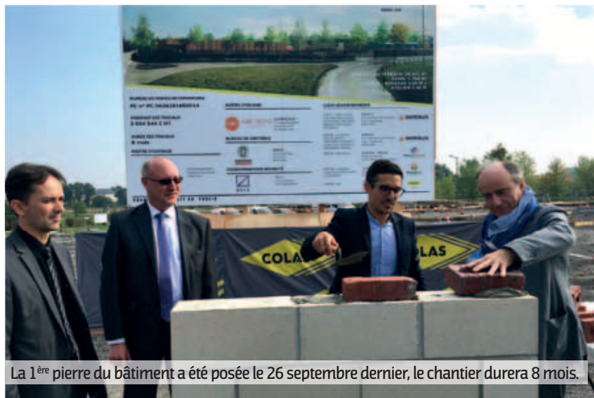
La 1 ère pierre du bâtiment a été posée le 26 septembre dernier, le chantier durera 8 mois.