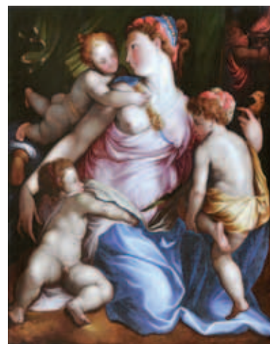
D'après Francesco Salviati (Florence, 1510 – Rome, 1563) La Charité, vers 1550, huile sur bois. La Fère, Musée Jeanne d'Abouville