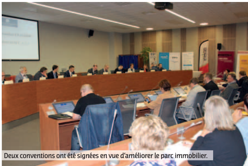
Deux conventions ont été signées en vue d'améliorer le parc immobilier.

Les rencontres de l'habitat se sont déroulées le 29 septembre dernier dans les locaux de la CALL. Ce rendez-vous annuel a été marqué par la signature de 2 conventions, l'une avec le CERQUAL et le second avec GRDF. La contractualisation avec le CERQUAL va permettre de certifier les logements sociaux construits ou rénovés sur les 36 communes de la CALL. Le CERQUAL est un organisme certificateur qui collabore sur le territoire avec la quasi-totalité des opérateurs du logement locatif social.