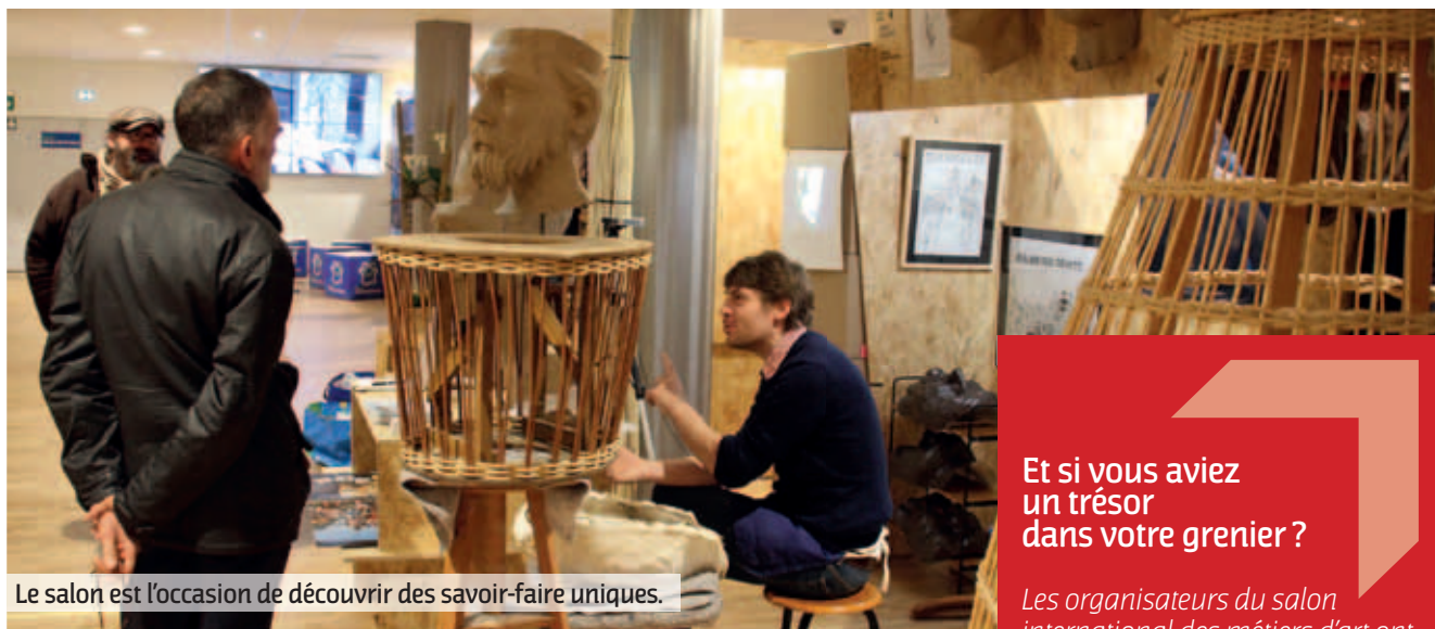
Le salon est l'occasion de découvrir des savoir-faire uniques.

Le salon international des métiers d'art se déroulera dans les salons prestige du stade Bollaert-Delelis les 3, 4 et 5 novembre prochains. Organisé par l'Institut des Métiers d'Art et du Patrimoine, ce rendez-vous accueillera 150 exposants, des professionnels des métiers d'art mais aussi des centres de formation.