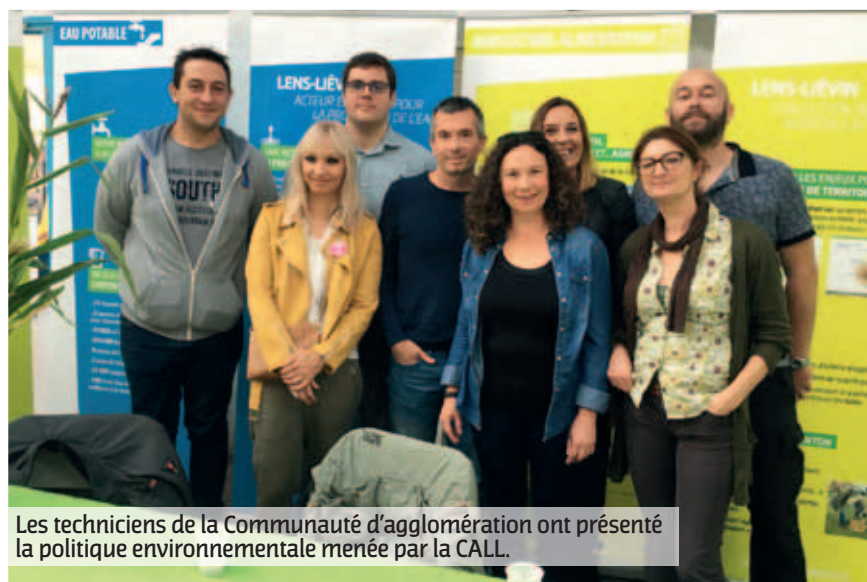
Les techniciens de la Communauté d'agglomération ont présenté la politique environnementale menée par la CALL.