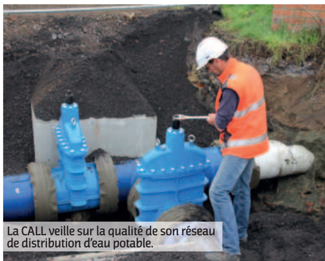
La CALL veille sur la qualité de son réseau de distribution d'eau potable.

La CALL dispose d'ouvrages en dehors de son territoire. C'est le cas des forages de Beuvry qui alimentaient la commune de Sains en Gohelle. Grâce aux travaux d'interconnexion, la commune pourra désormais être alimentée par le réseau de distribution du territoire. Pour cela, les services de la CALL ont réalisé (sous maîtrise d'ouvrage et maîtrise d'œuvre interne) ces travaux d'interconnexion.