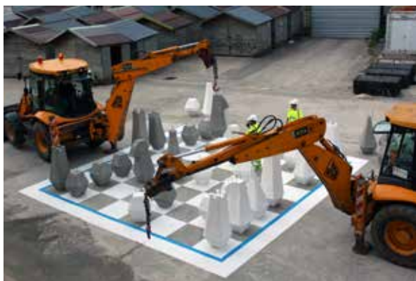
Echiquier © Aymeric Caulay